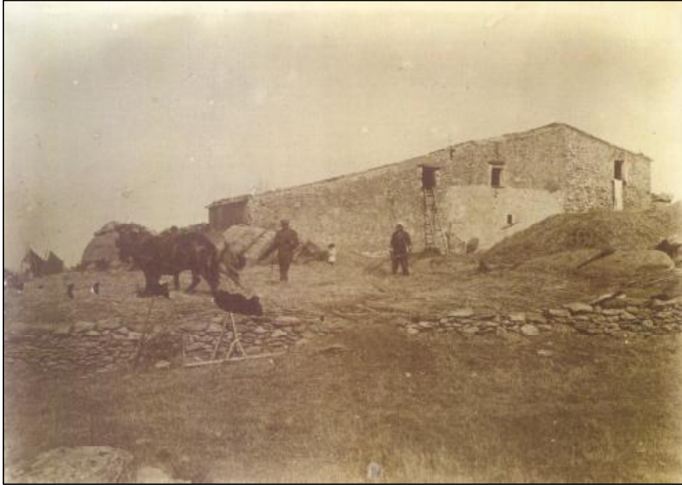
Foto 4. El mas dels meus avis, Can Magí, a Sant Pere de Rodes (Port de la Selva).