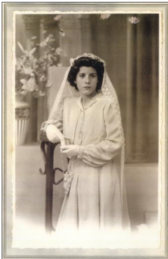
Foto 19. Aquesta foto és de la meva Primera Comunió, a l'edat de deu anys.