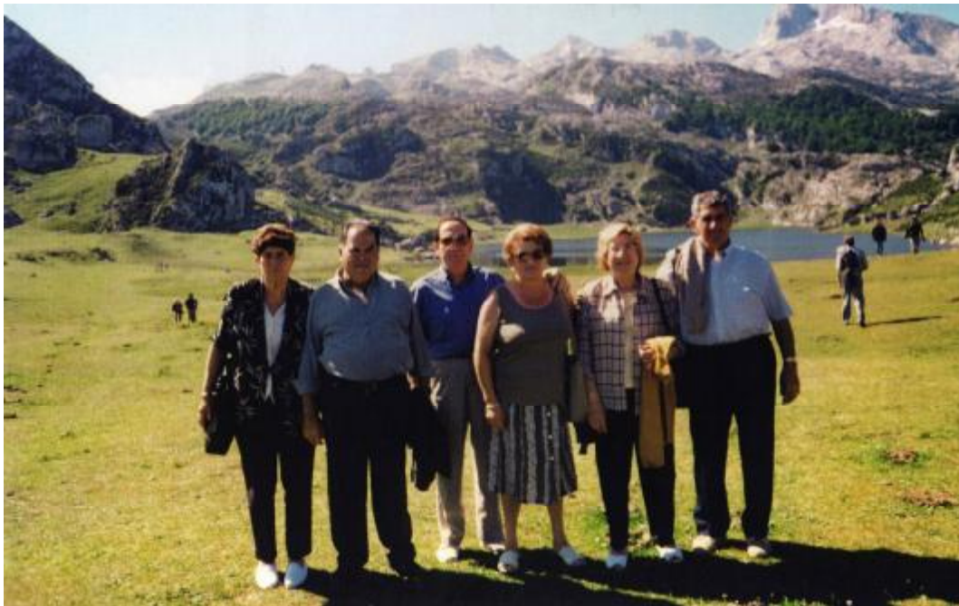
Foto 62. Excursió a Lagos de Covadonga en uns amics, l'any 2000.