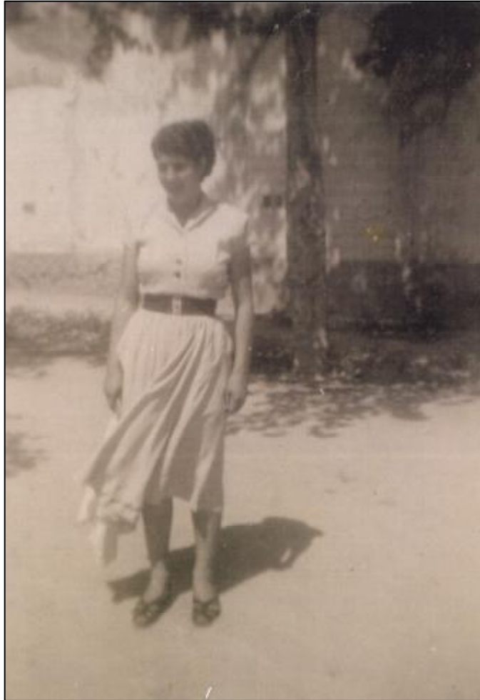
Foto 8. En la carretera de Roses, a l'edat de 16 anys.

5kg de farina; 30 ous; 2kg de sucre; 1 got d'anís; 4 llimones; 2 tubs de vainilla; 100g de mataluga; 150g de llevat de cervesa; 250g de llevat de pa; 250g de mantega; 200g de greix de porc; un polsim de sal. Què bons!.