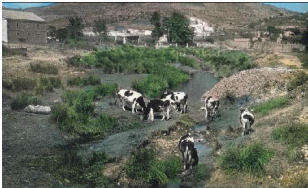
Foto 13. En aquesta fotografia s'aprecia les vaques d'en Miquel de "Cal Negus".

Glòria no ens deia mai res. Tots hi anàvem, cada dia, a jugar a fet i amagat per sota dels llits, per darrera de les cortines,...Quina paciència tenia la senyoreta!.