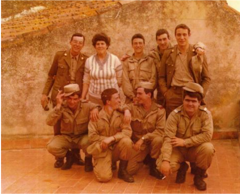
Foto 40. Records del CIR nº9, en Sant Climent de Sescebes.