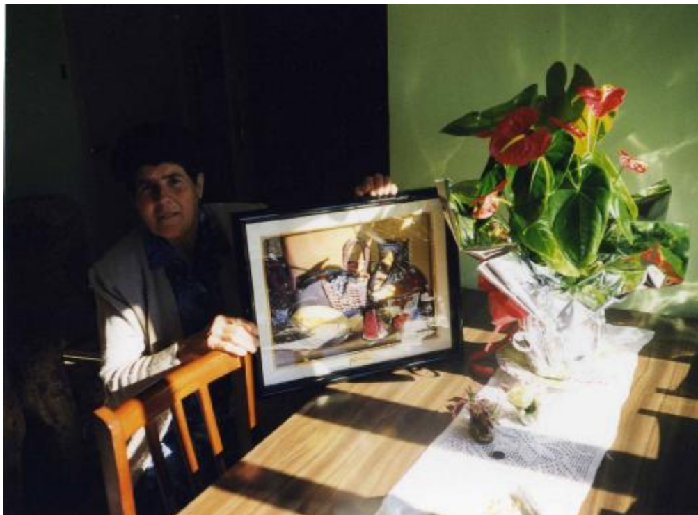
Foto 33. El día que vaig cumplir 65 anys.

Ara que em trobo ja en la tercera edat i superant dificultats, sóc feliç. Tinc un home bo, una filla i un gendre a més a més de néts que em demostren una gran estima amb visites, amb cartes i telefonades que em donen vida i fan que no em senti vella. De petita em varen ensenyar que s'havia de ser amable i carinyosa amb tothom, sembrant amor i amistat i així he pogut recollir també eixe amor i eixa amistat sembrada... També vull dir que no sóc rasista, per la meua forma de pensar tots som iguals davant de Déu.