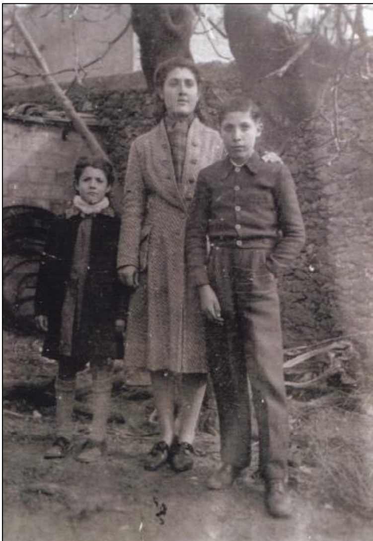
Foto 12. Aquesta foto la vàrem fer per al meu pare, perquè ens coneguera allà al camp de concentració, la meua germana tenia disset anys, el meu germà dotze i jo quinze anys.