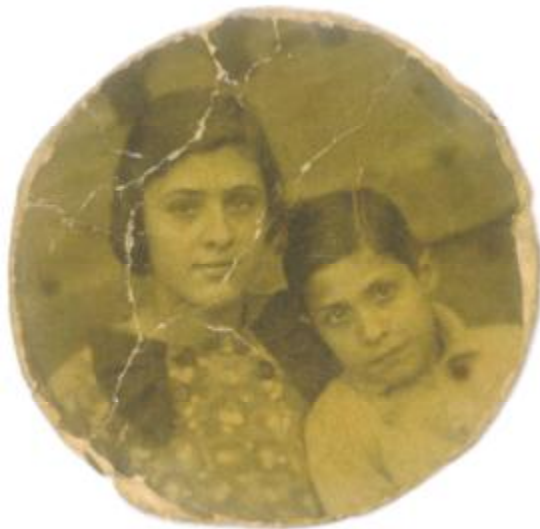
Foto 10. La meva germana i el meu germà, quan tenien quinze i deu anys, respectivament.

Al túnel d'anar a Llançà hi havia bombes per explotar i jo recordo que dormíem en un mateix llit sis mainades del través i els meus cosins igual.