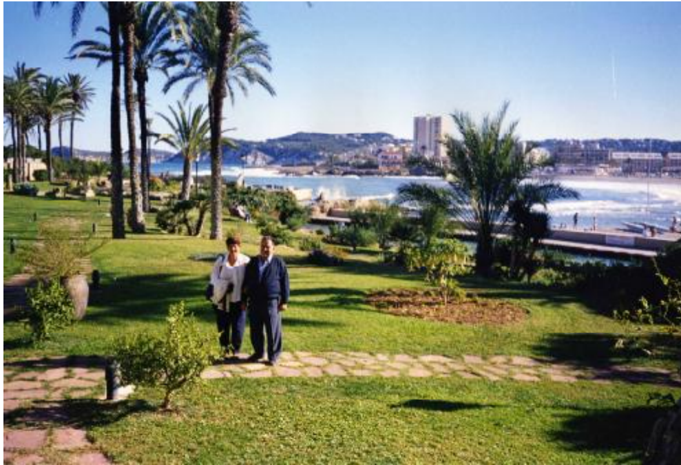
Foto 63. Excursió a Xàbea, en la Comunitat Valènciana, l'any 2.000.