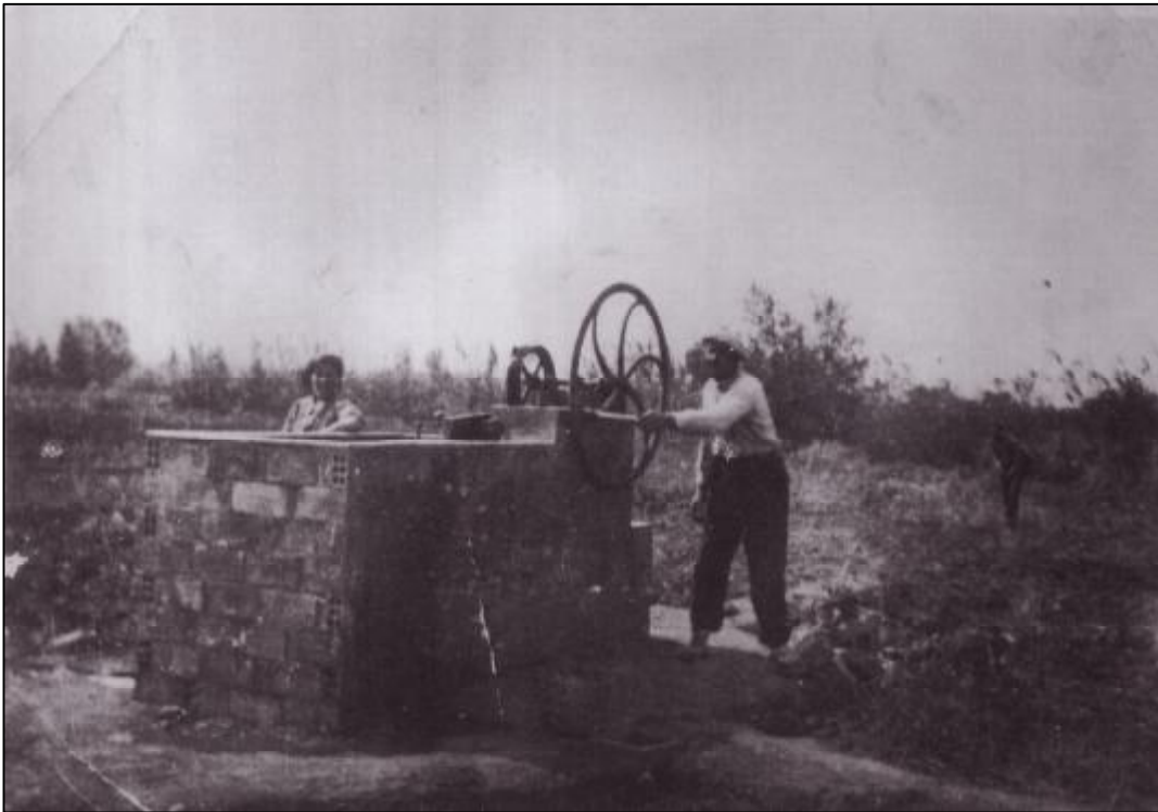
Foto 1. Els meus pares anegant el hort de Marçà, any 1935.

En l'any 1998, després de més de 50 anys, hi ha diners i llibertat, però la joventut passa de tot, la gent no té temps per a fomentar relacions d'amistat i moltes vegades ni en el propi àmbit familiar hi ha estima i respecte entre pares i fills.