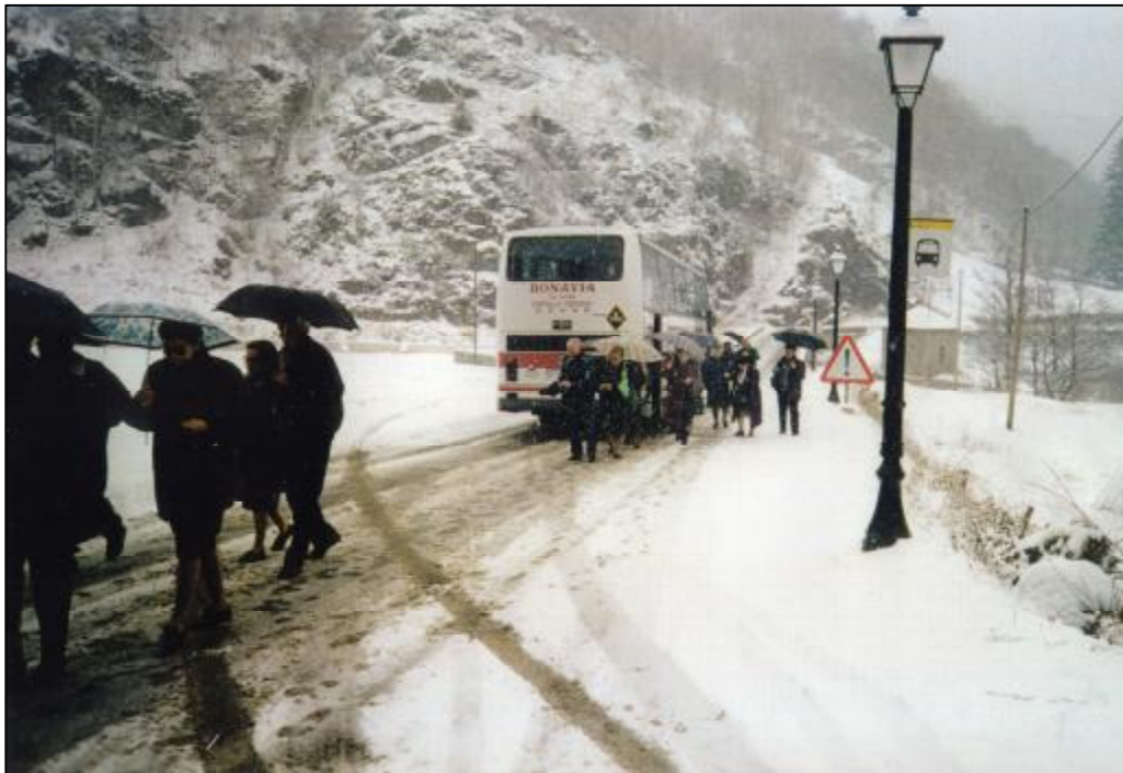
Foto 58 . Excursió a Set Cases en Camprodon (Girona), l'any 1999.