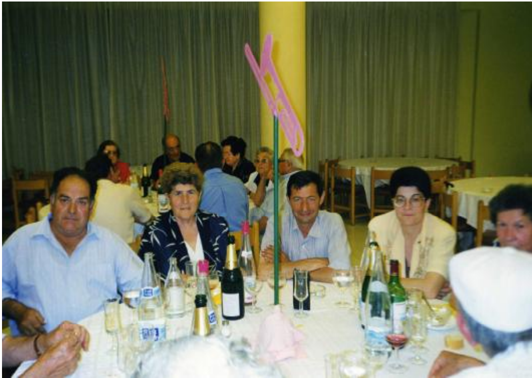
Foto 61. Excursió amb els fills en Platja d'Aro.