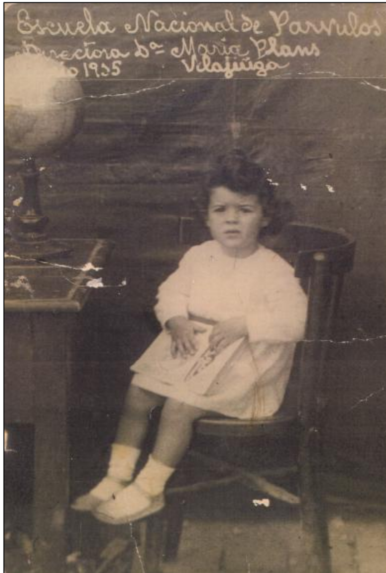
Foto 9. A l'escola de Vilajuiga, quan jo tenia 2 anys.