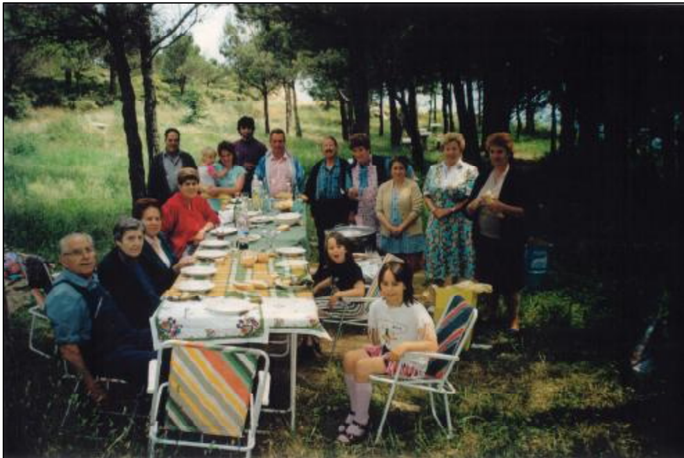
Foto 5. Un dinar de família al Mas Ventós, l'estiu de l'any 1998.