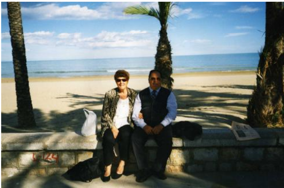
Foto 60. Una altra imatje de l'excursió a Peñíscola, en l'any 1.999.