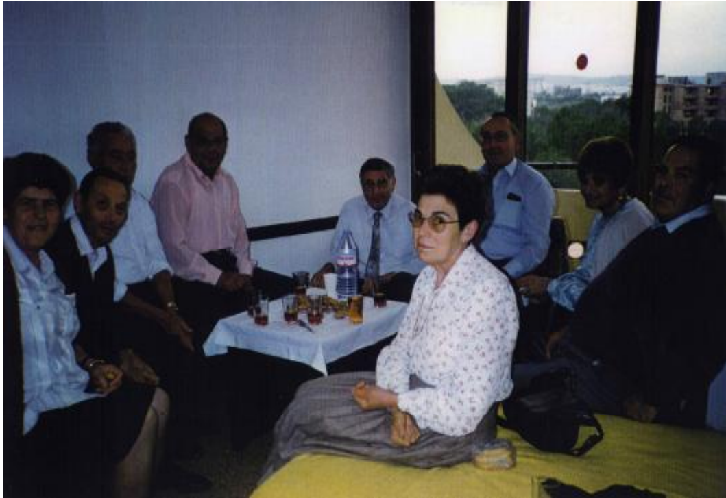
Foto 53. La primera excursió del INSERSO en Ibiza, era l'any 1990.