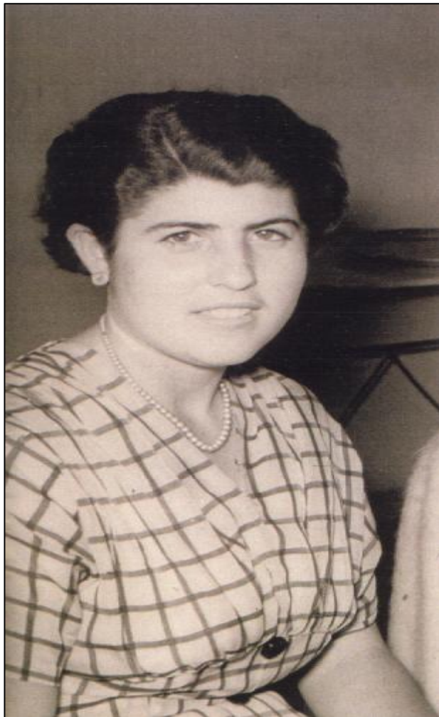
Foto 20. Entre els 17 i els 18 anys amb un vestit fet per mi mateixa.

Aquesta edat dels 15 als 17 anys és l’edat més maca, pensant el dilluns per arribar el diumenge i poder ballar els “pasodobles” i “fox” amb el noi que t’agradava més.