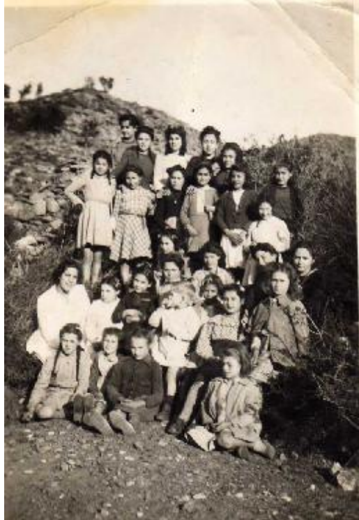
Foto 18. Excursió del Col·legi “Escuelas Nacionales Vilajuiga”, en l’any 1945, tenia per entonses 12 anys.