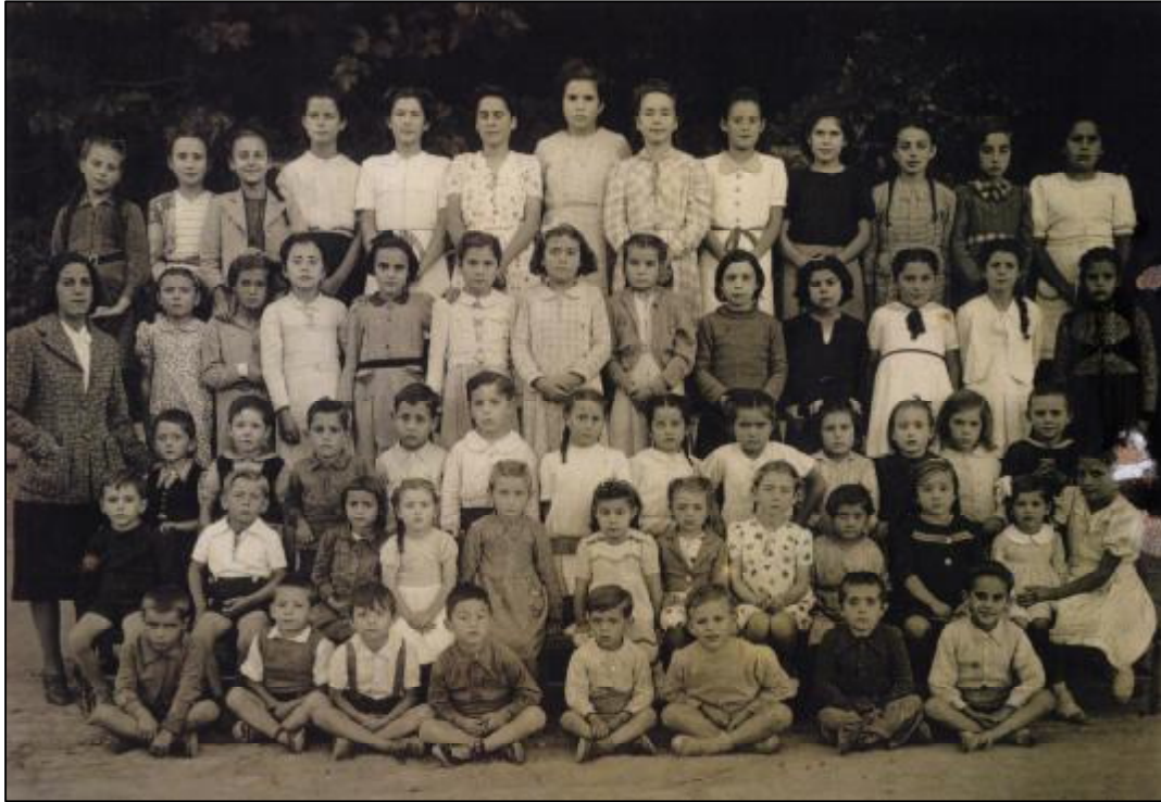
Foto 17. Aquesta foto és à l'escola, quan jo tenia entre deu u onze anys.

Recordo que quan venia “la Festa”, la meva mare no tenia diners per anar a les barques i uns dies abans, buscava parracs, casquets de bombeta, ferros,... i així aconseguia algun diner. Però jo sempre estava contenta somiant amb coses que no venien mai!.